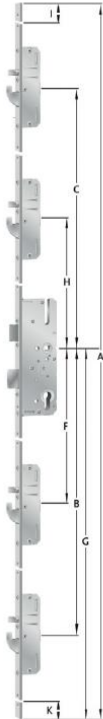
Schwenkriegel mit oder ohne Rundbolzen